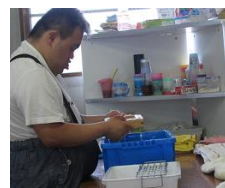
⑤型に入れて紙漉きをする