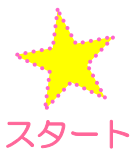
①牛乳パックを切って圧力鍋で煮る

今回は週に2回取り組みされている「手作り紙漉きハガキ」を写真とともに手順を交えながら紹介いたします。